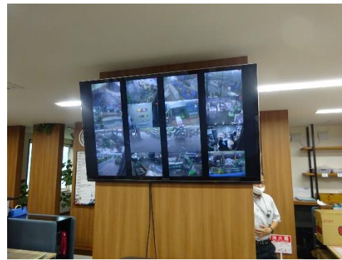
事務所内施設管理モニター