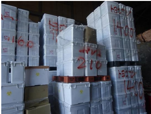
焼却前感染性廃棄物