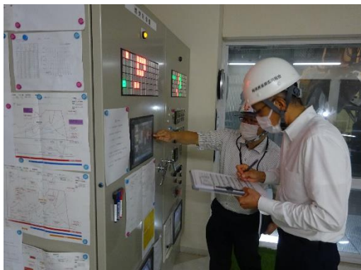
焼却炉のデータ確認