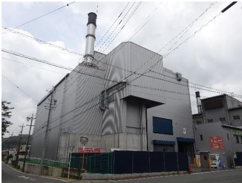
加山興業工場全体