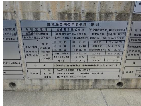
中間処理施設の表示