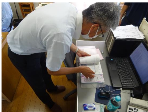
受渡確認票の確認