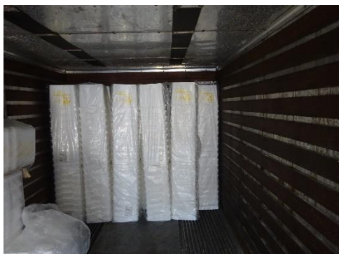
使用前容器の保管状況