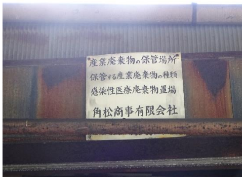
感染性廃棄物保管場所の表示