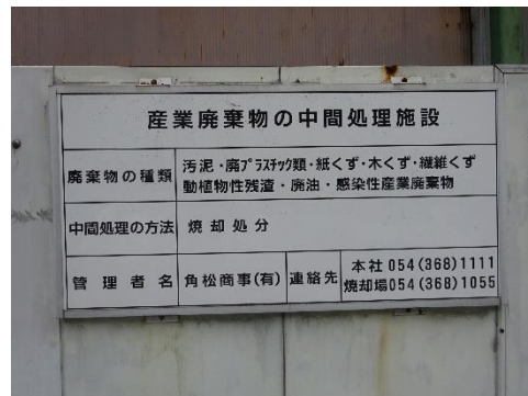
中間処理施設の表示