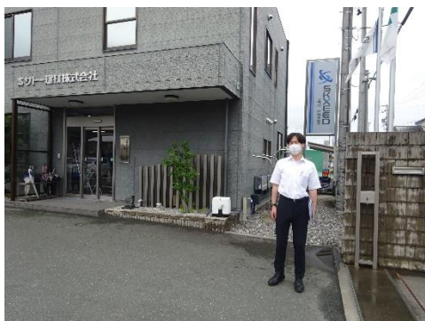
エスケード本社前