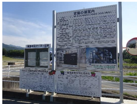
中間処理施設の表示