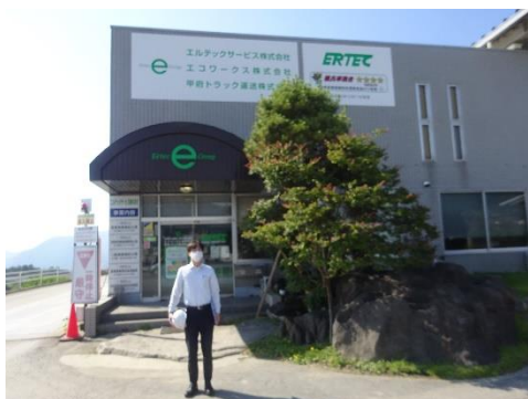
エルテックサービス本社前