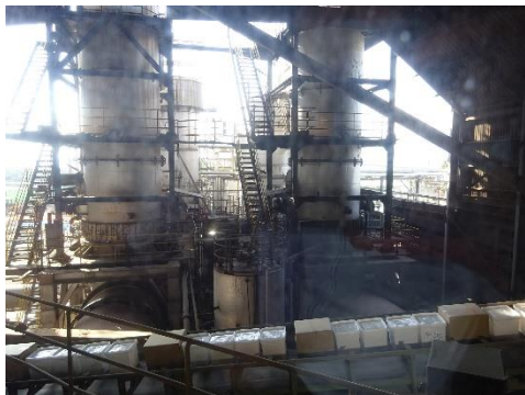
ロータリーキルン (2機)