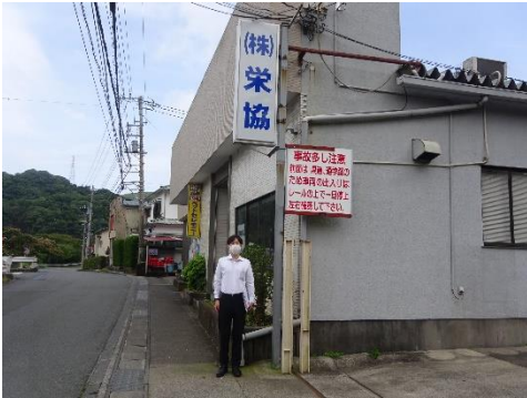
栄協 下田事業所前