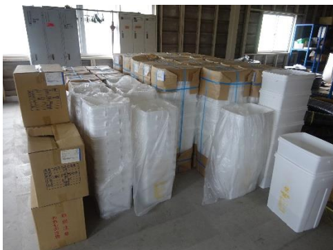
使用前容器の保管状況