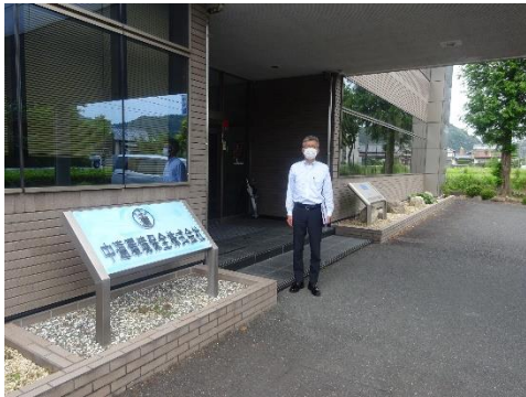
中遠環境保全本社前