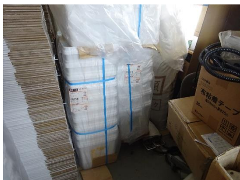
使用前容器の保管状況