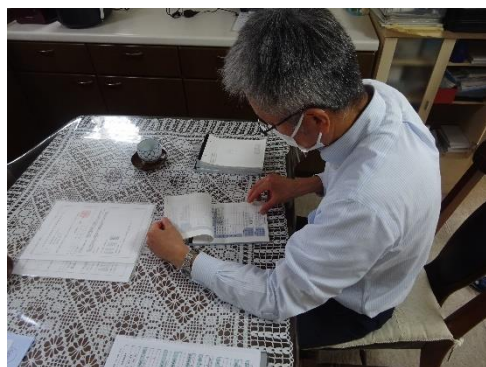
受渡確認票の確認