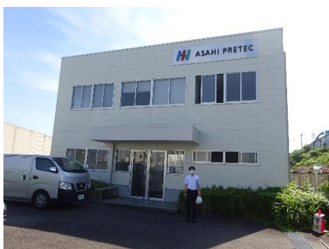
アサヒプリテック静岡営業所前