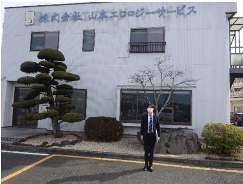
山本エコロジーサービス本社前