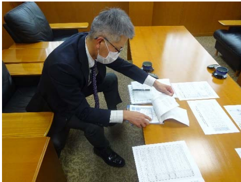
受渡確認票の確認