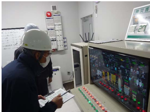
焼却炉のデータ確認