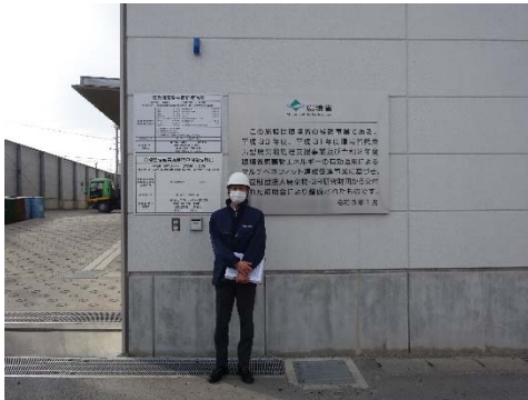
明輝クリーナー原町工場前