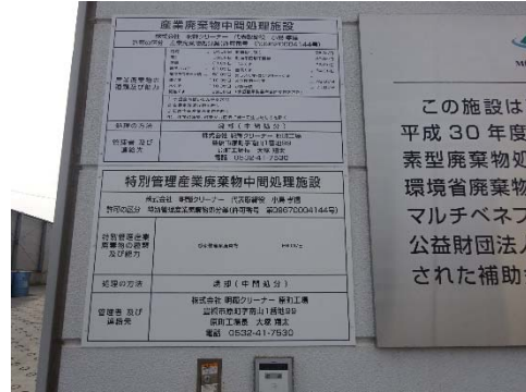
中間処理施設の表示