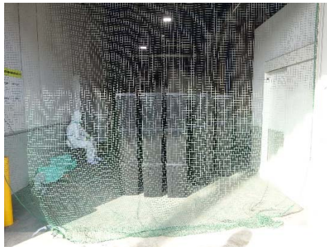
感染性廃棄物搬入口