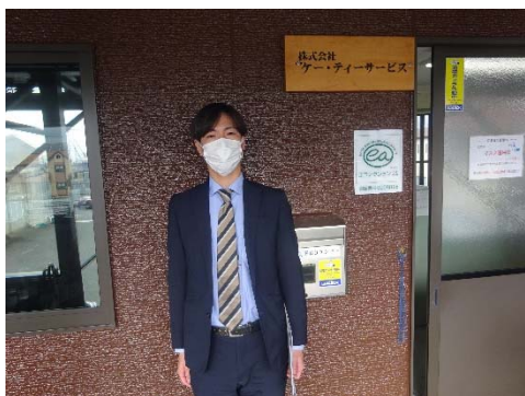
ケー・ティーサービス本社前