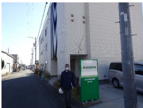
加山興業事務所前