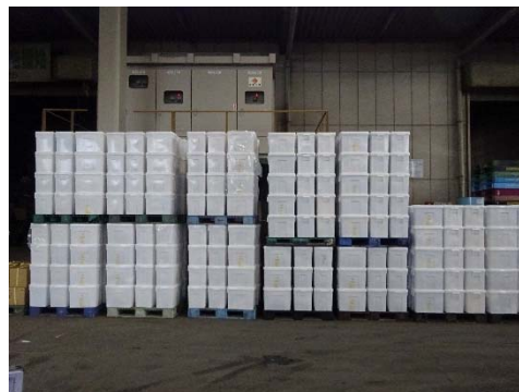
使用前容器の保管状況