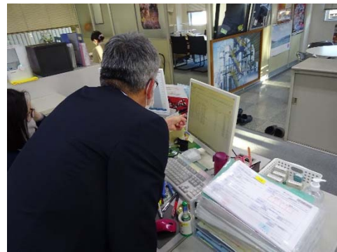
電子マニフェストの確認