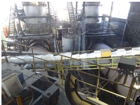
ロータリーキルン炉（2基）