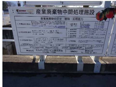
中間処理施設の表示