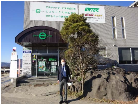
エルテックサービス本社前