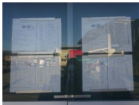
環境測定データの情報公開