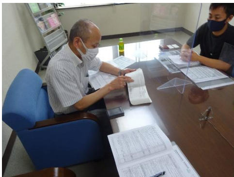
受渡確認票の確認