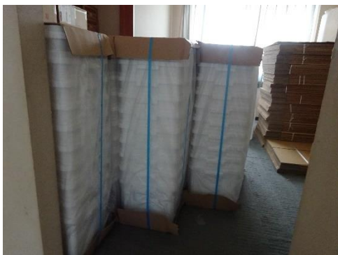
使用前容器の保管状況