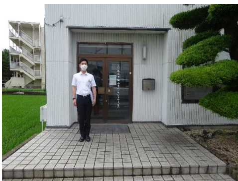
山本エコロジーサービス本社前