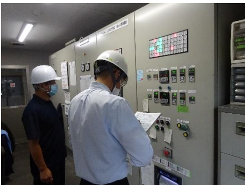
焼却炉のデータ確認