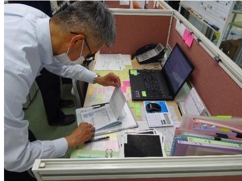
受渡確認表の確認