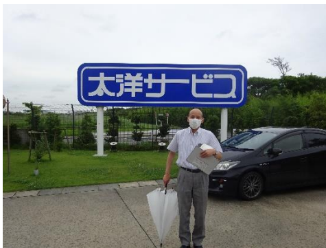
太洋サービス産廃処理工場