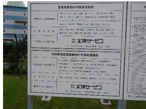
中間処理施設の表示