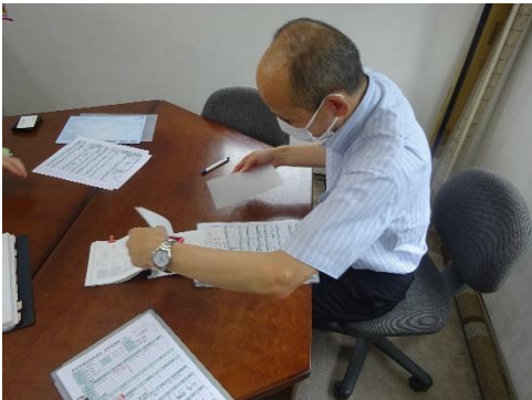
受渡確認票の確認