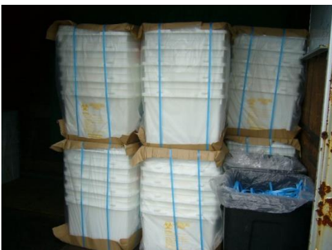
使用前容器の保管状況