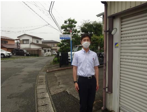
さとう産業本社前