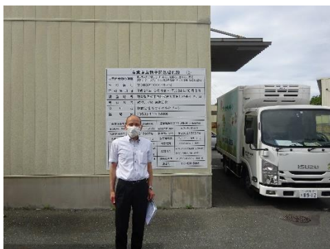
リサイクルクリーン桜台工場前