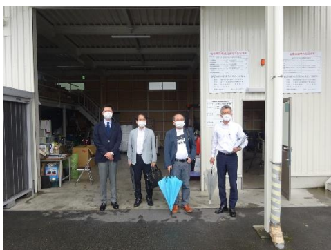
日本産業廃棄物処理本社前