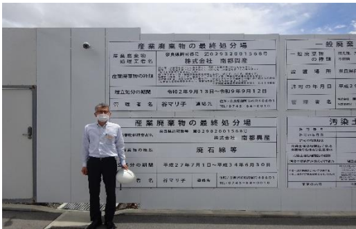
最終処分場の入口