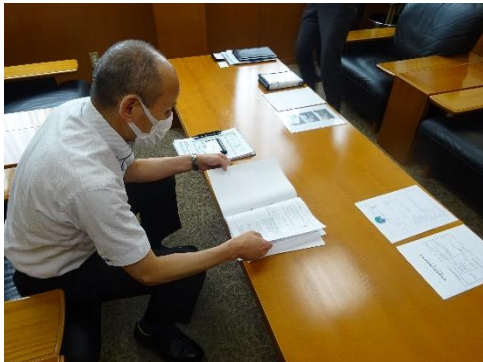
受渡確認票の確認