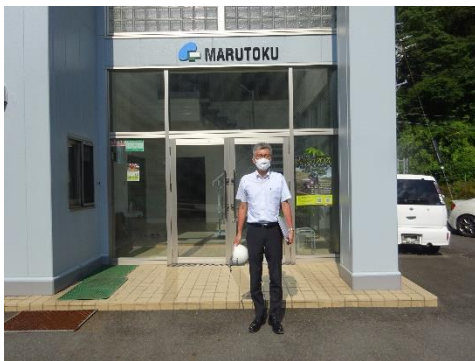
丸徳商事宍原事業所前