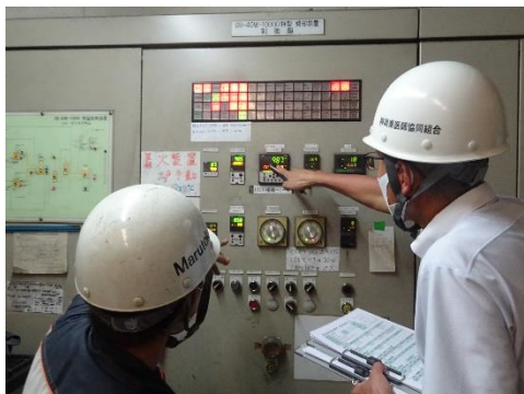
焼却炉のデータ確認