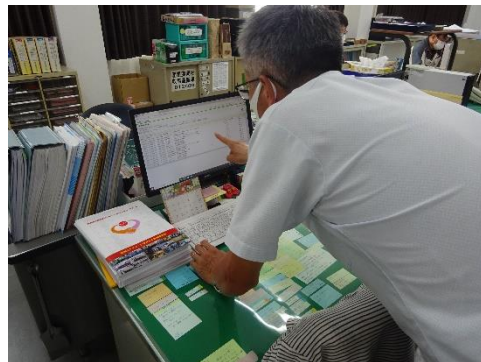
電子マニフェストの確認