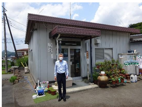
マエダ美化 営業所前