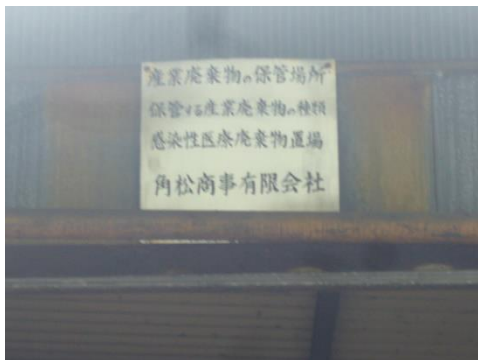
感染性廃棄物保管場所の表示