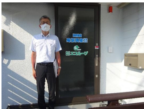
庵原興産松野事務所前