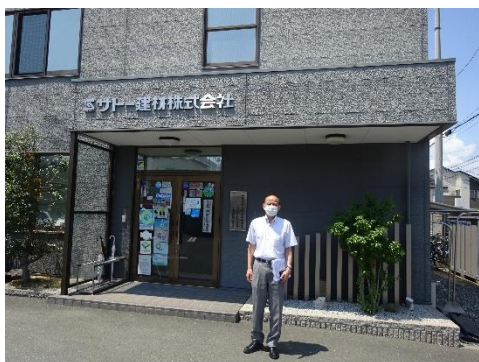
エスケード（旧サトー建材）本社前