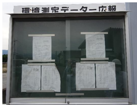
環境測定データの情報公開