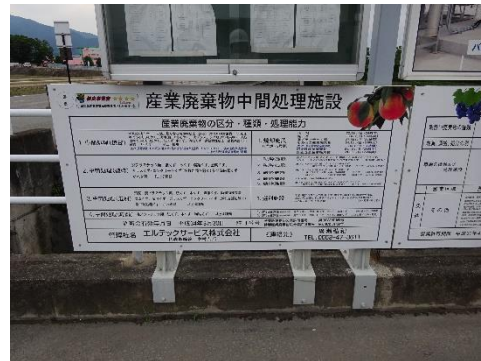
中間処理施設の表示