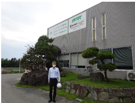
エルテックサービス本社前