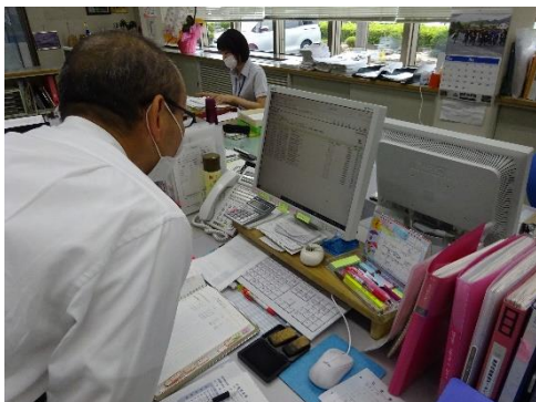
電子 manifests の確認