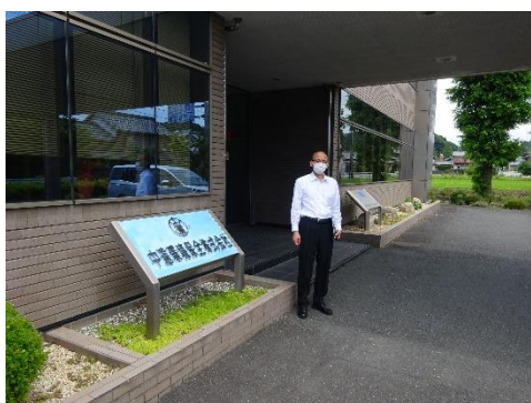
中遠環境保全本社前