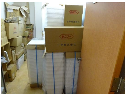
使用前容器の保管状況