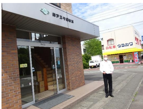
アスク長谷川本社前