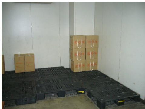
産業廃棄物保管場所