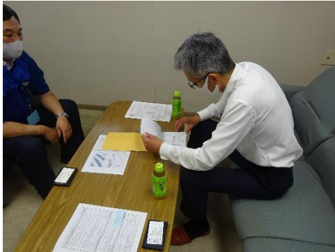
受渡確認票の確認