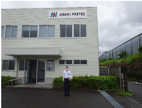
アサヒプリテック静岡営業所前