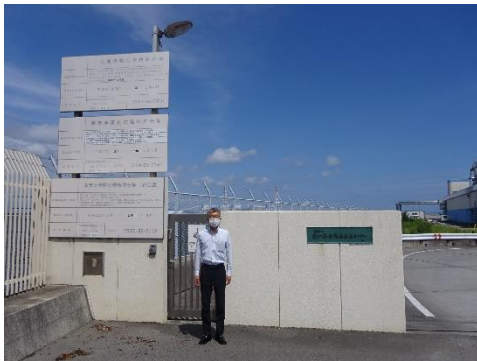
最終処分場事務所入口