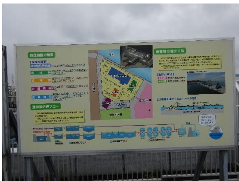
埋立地の説明表示