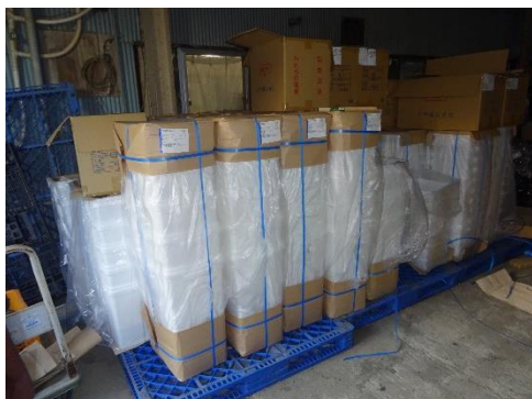
使用前容器の保管状況