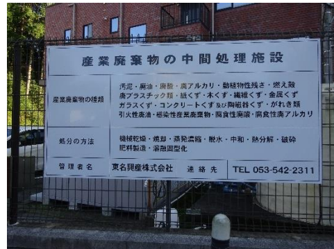
中間処理施設の表示