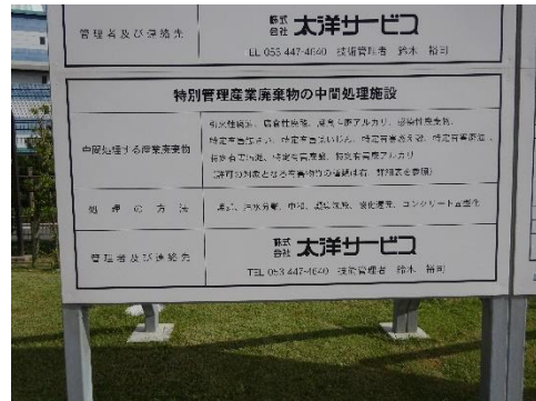
中間処理施設の表示