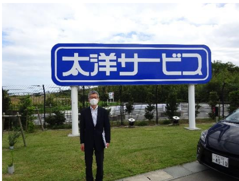
太洋サービス産廃処理工場