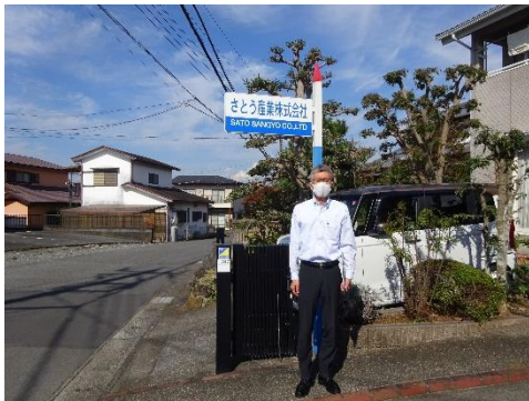
さとう産業本社前