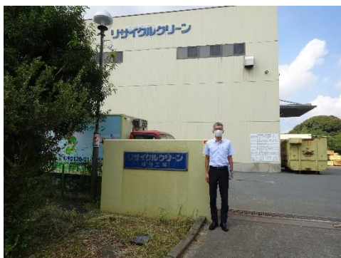
リサイクルクリーン桜台工場前