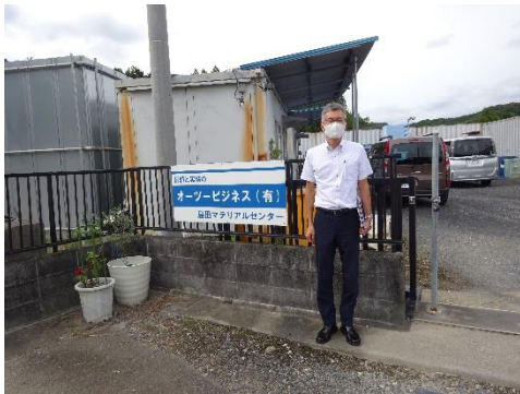
マテリアルセンター事務所前