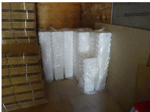
使用前容器の保管状況