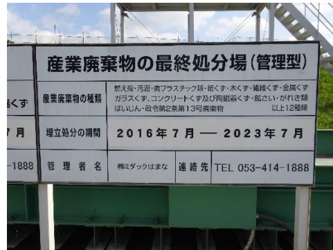
最終処分場の表示