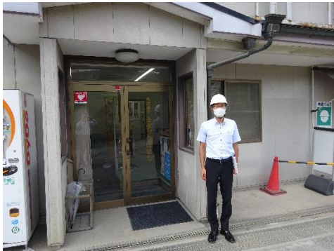
遠州クリーンセンター管理事務所前