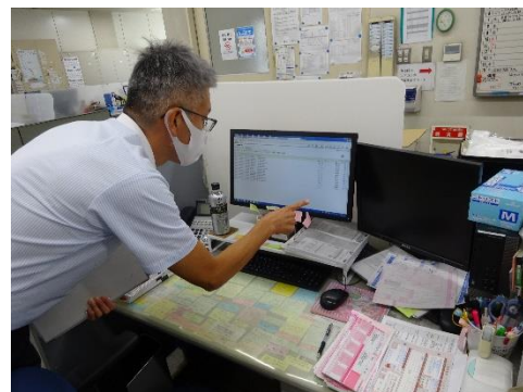
電子 manifests の確認