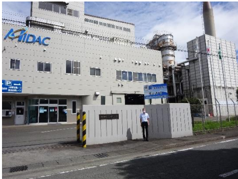
ミダック富士宮事業所前