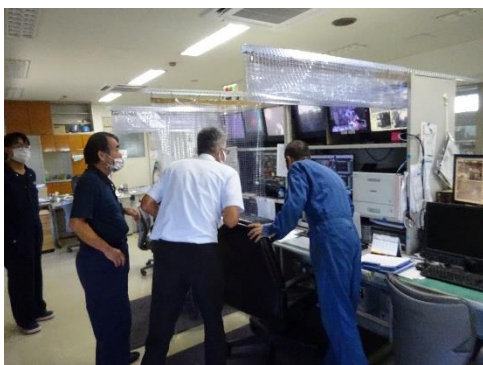
焼却炉のデータ確認