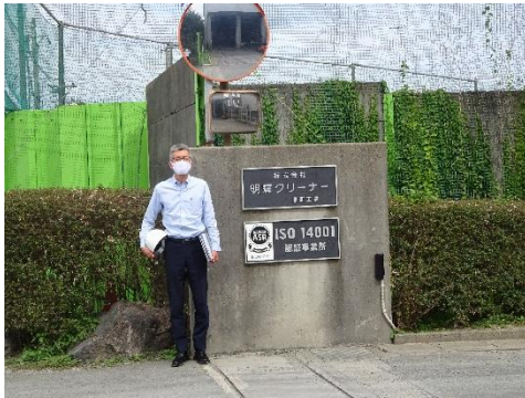
明輝クリーナー原町工場前