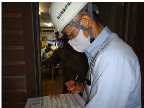
焼却炉のデータ確認