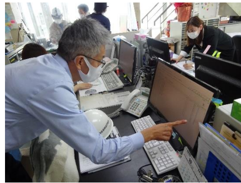
電子 manifests の確認