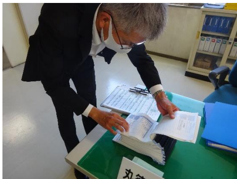
受渡確認票の確認