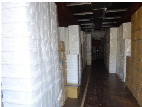
使用前容器の保管状況