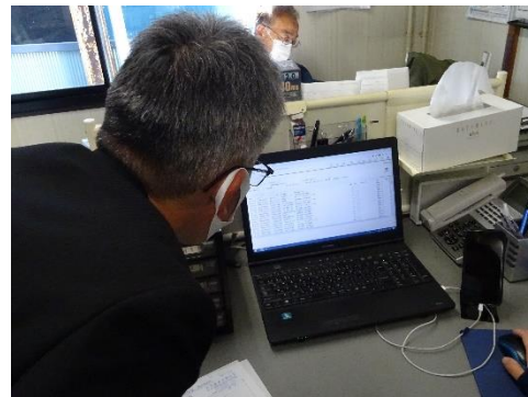
電子 manifests の確認