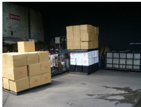
投入前の感染性廃棄物