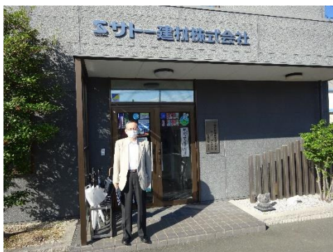
エスケード（旧サトー建材）本社前