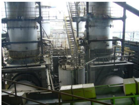
ロータリーキルン炉（2基）