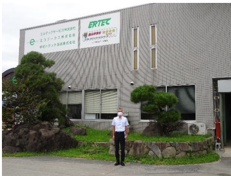
エルテックサービス本社前