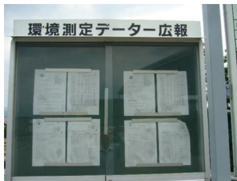
環境測定データの情報公開