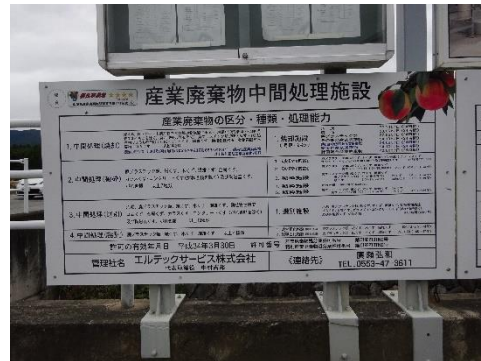
中間処理施設の表示