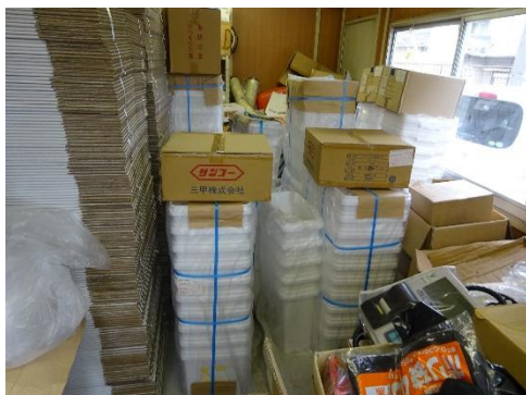
使用前容器の保管状況