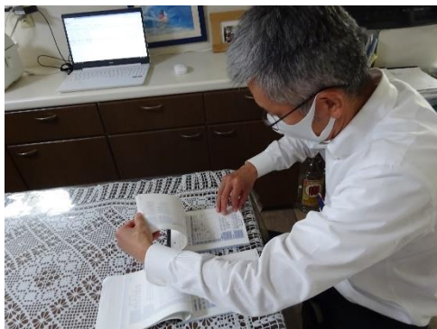
受渡確認票の確認