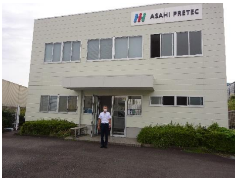
アサヒプリテック静岡営業所前