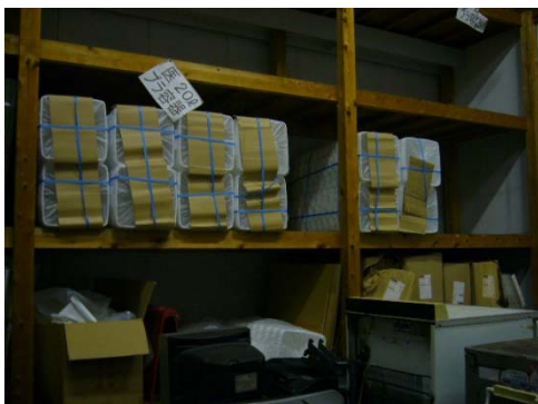
使用前容器の保管状況